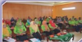
Gedung Serba Guna