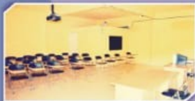
Ruang Pembelajaran Mikro